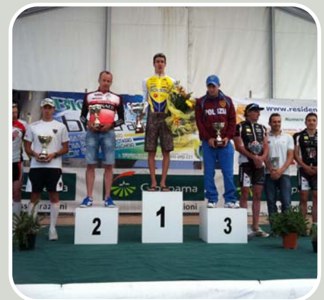
PODIO GARA MASCHILE

Tra i ringraziamenti, un grazie particolare per il sostegno è stato dato agli sponsor privati tra cui BioKMag integratore minerale alcalino - citrato di potassio e magnesio nel contrasto dell'acidosi metabolica.